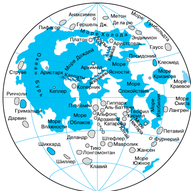
Рис. 3. Карта видимого полушария Луны