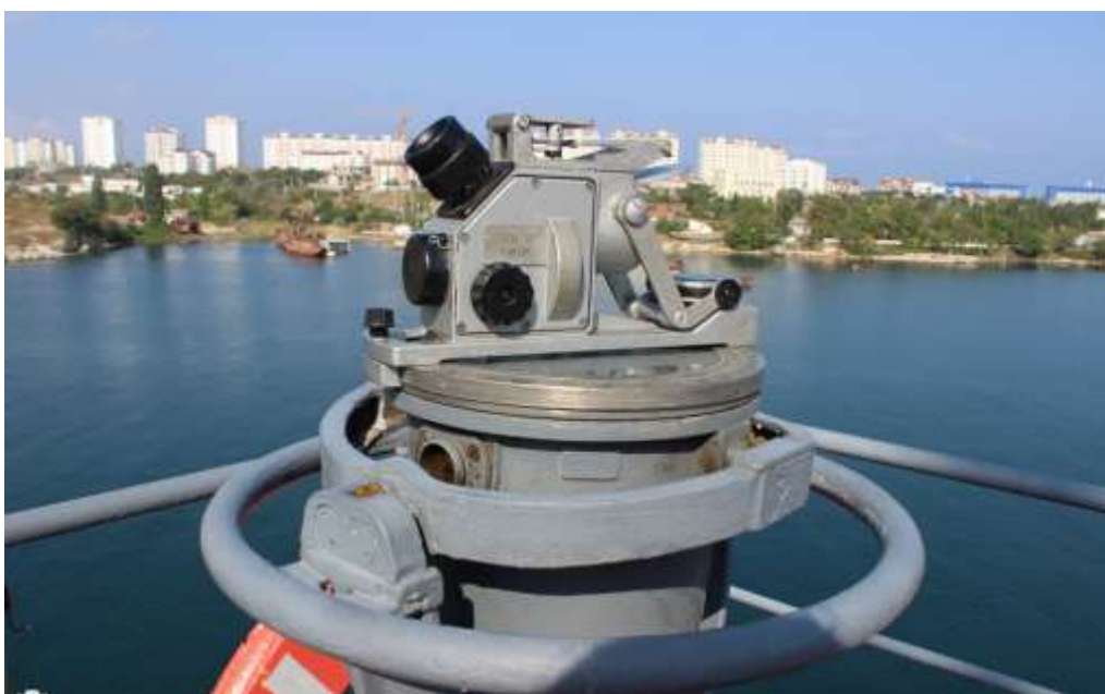
Пеленгатор и гидрокомпас

Пеленгаторы - используются для определения пеленгов и курсовых углов. Существуют как насадки на главный компас.